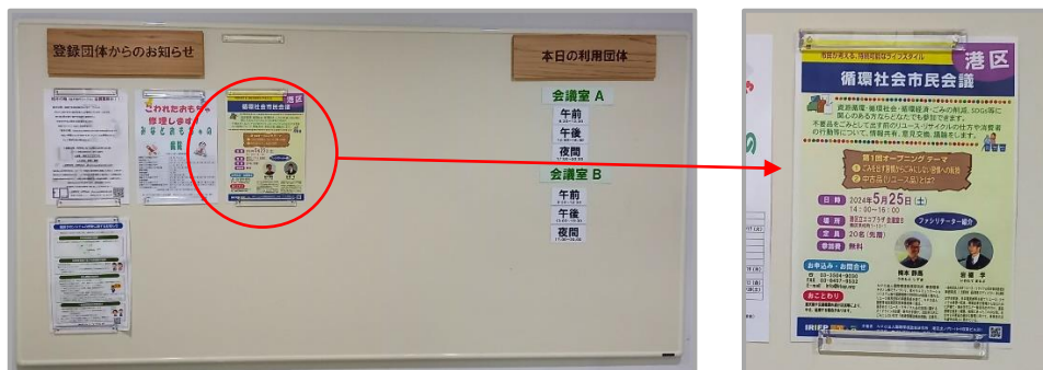
港区立エコプラザ1階掲示板と案内チラシ