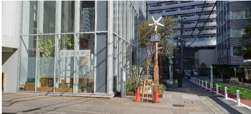
港区立エコプラザ